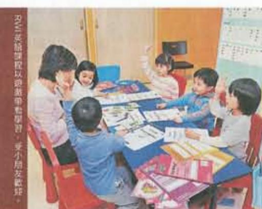
RWI英語課程以遊戲學習，受小朋友歡迎。