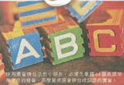
使用原音拼合法的小朋友，必須先掌握44個英語常用音素的發音，再學習將原音拼合成詞的讀音。

21世紀的孩子真幸福，被父母呵護備至，不過過甚甚至是不當的愛，或會讓孩子們失去競爭力。不如就等專家教路，讓你的孩子成為未來精英。